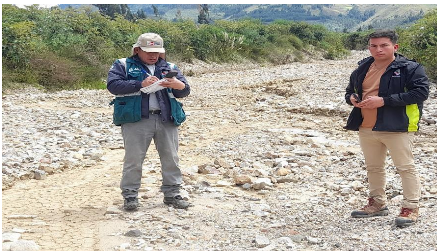
IMAGEN N°02: la quebrada Chiquichal se encuentra colmatada es necesario la intervención inmediata para el mantenimiento del cauce