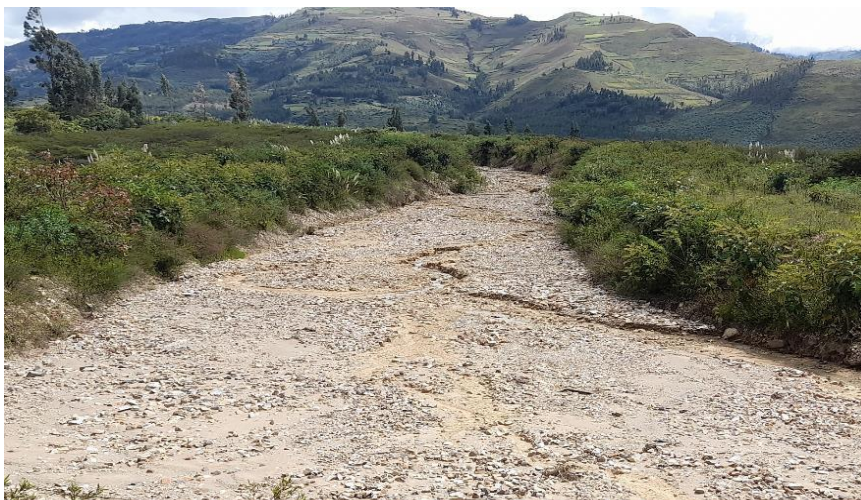
IMAGEN N°01: Se observa la quebrada Chiquichal requiere de mantenimiento de cauce y conformación de bordos